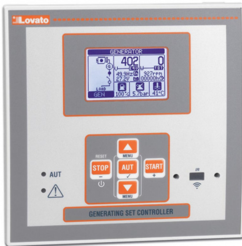
Lovato RGK600 - итальянский контроллер для управления дизельной электростанций, с широким функционалом и русскоязычным интерфейсом. Позволяет контролировать множество параметров работы установки во всех штатных режимах. Разработка итальянской компании Lovato Electric.